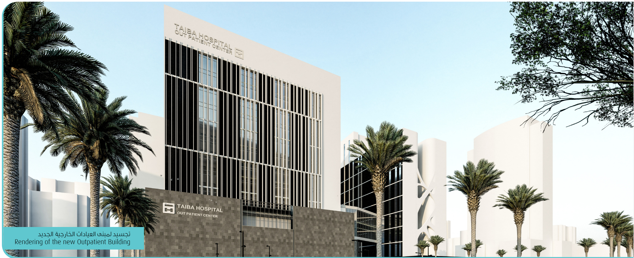
تجسيد لمبنى العيادات الخارجية الجديد Rendering of the new Outpatient Building